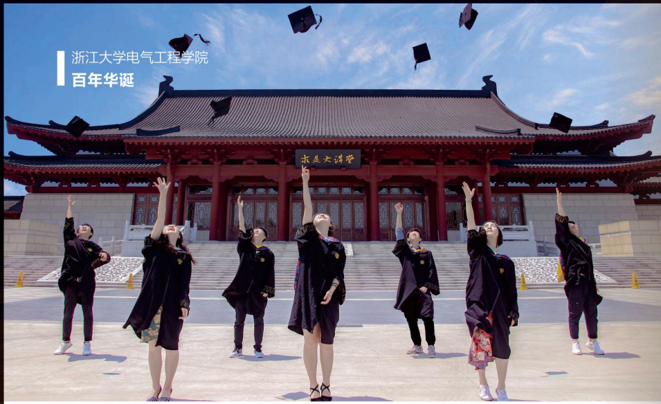
浙江大学电气工程学院 百年华诞