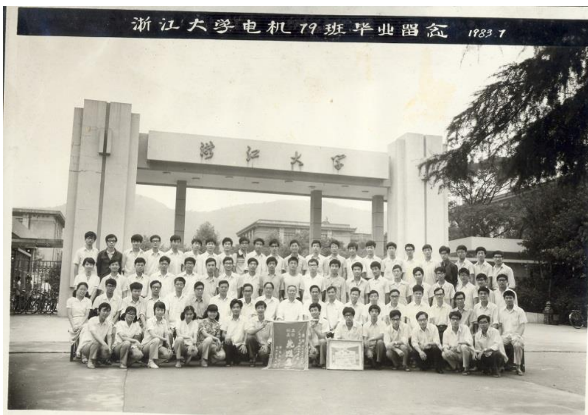
(1983年7月浙江大学电机专业79级毕业照片)

1983年7月，历史建筑“教二”如母亲般见证了我们当年62位电机专业79级本科生毕业惜别的一幕。