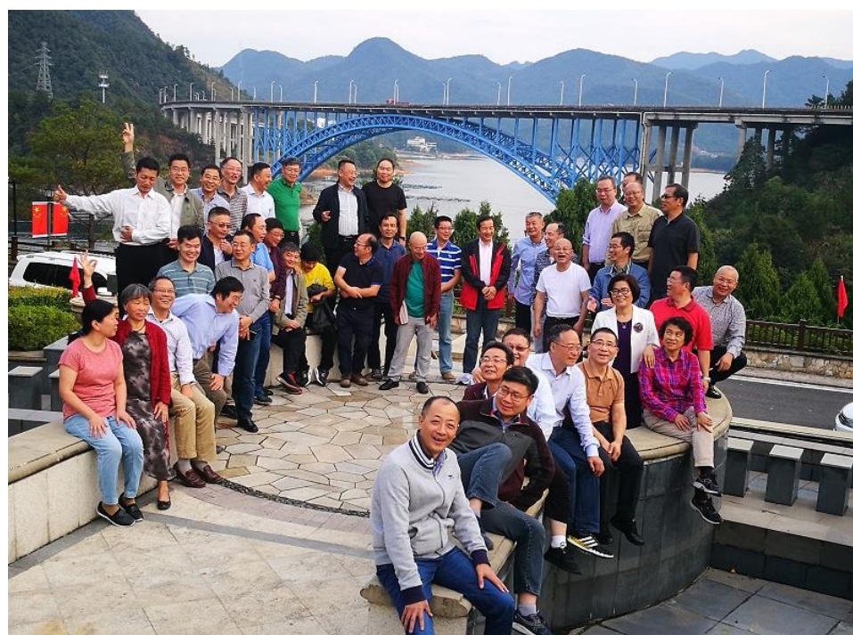
(千岛湖同学合影+同学含家属合影照片)