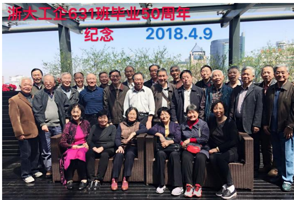
图/文：工企 631 班